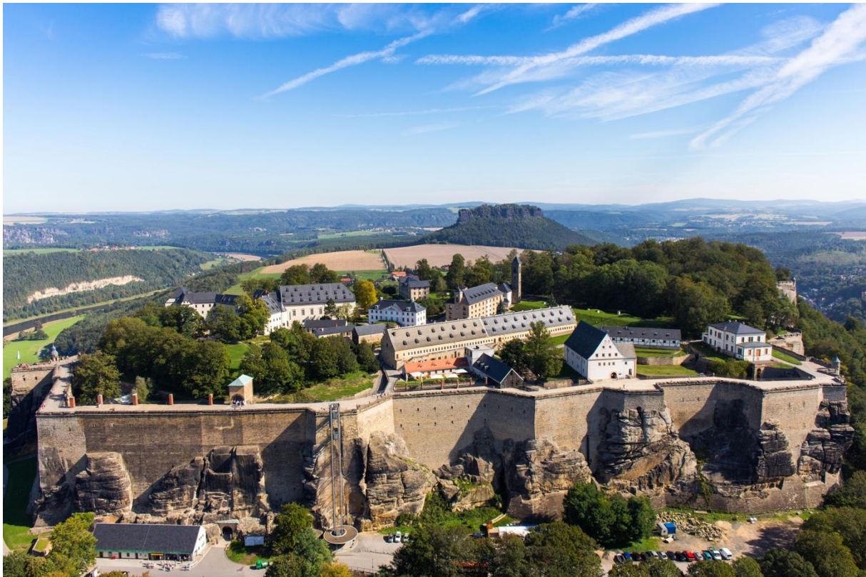
Auf der Festung Königstein in der Sächsischen Schweiz.