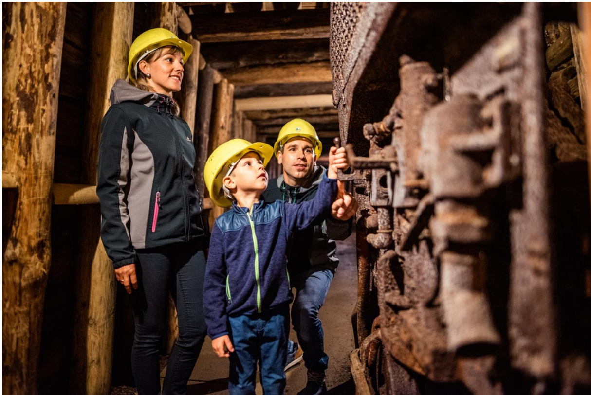
Bergbautradition und moderne Kreativräume finden sich im Erzgebirge.