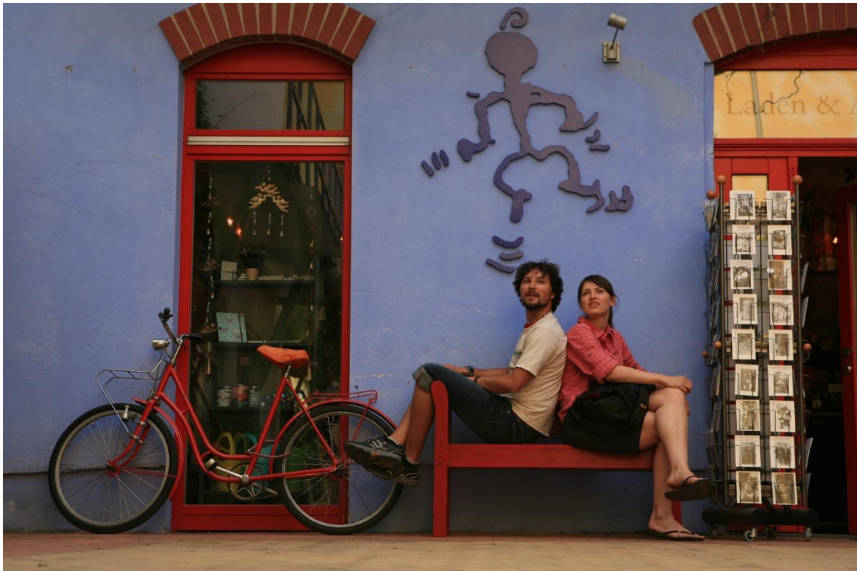
Die Kunsthofpassage in Dresden.