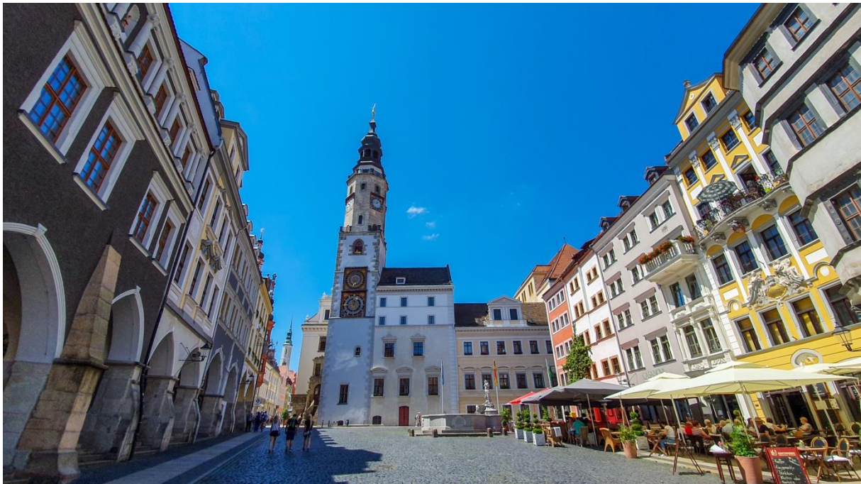
Görlitz besticht neben seiner sehenswerten Altstadt auch mit lebendiger Kulturszene