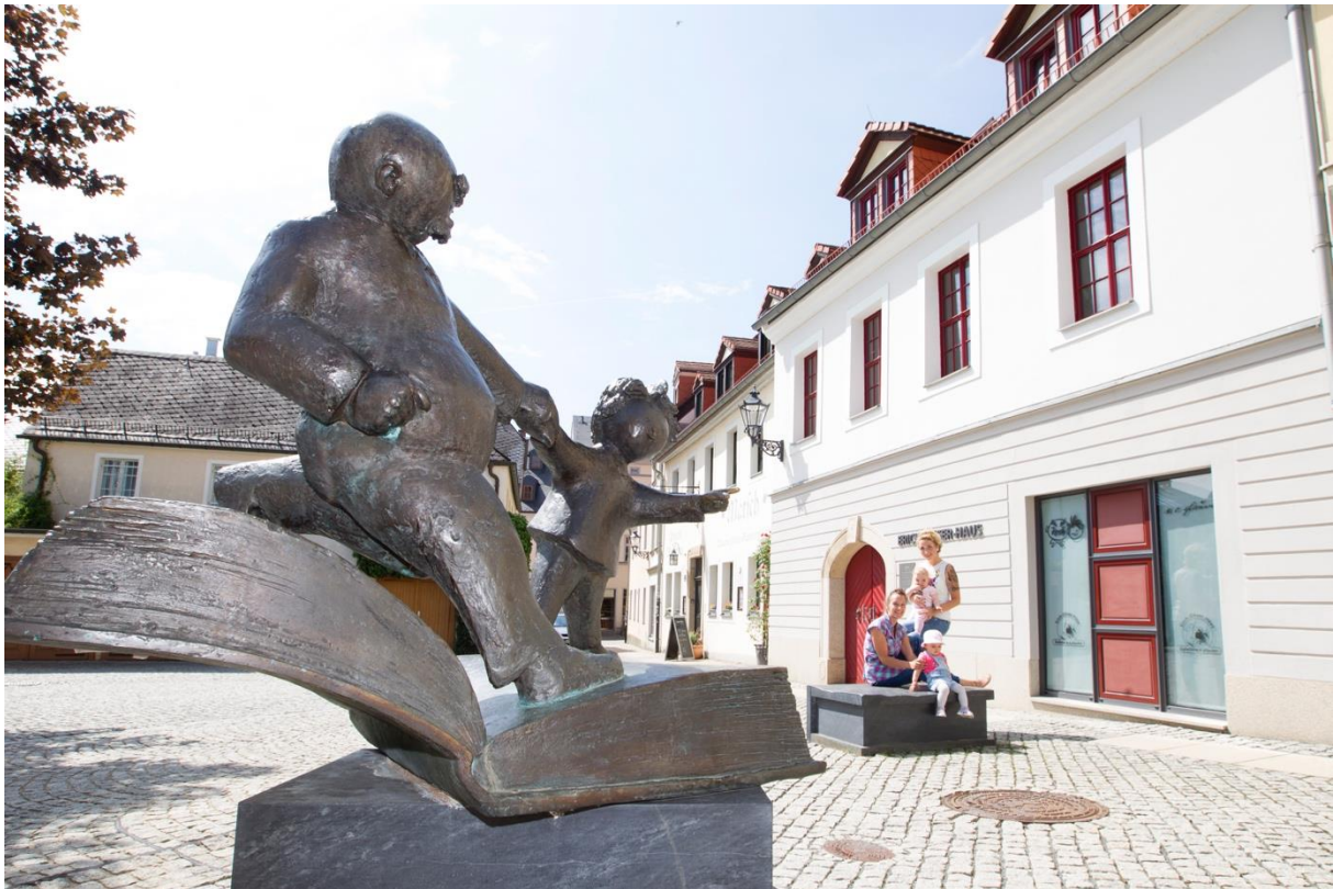
Eine Erich Ohser Vater-Sohn-Statue vor der Galerie e.o. plauen.