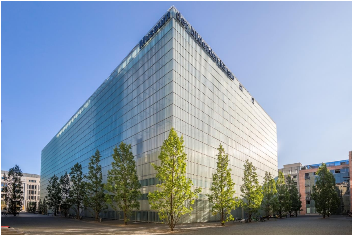
Das Museum der bildenden Künste in Leipzig ist auch von außen ein Kunstwerk.