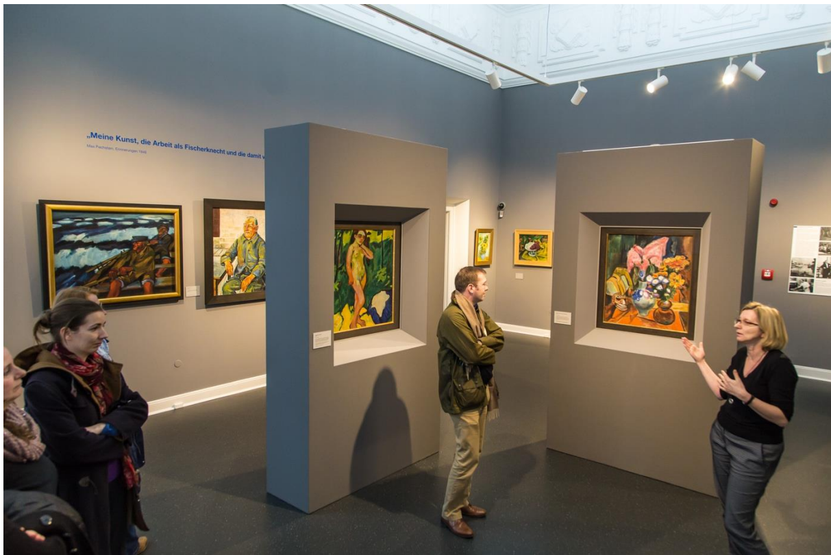
Das Max-Pechstein-Museum in Zwickau.