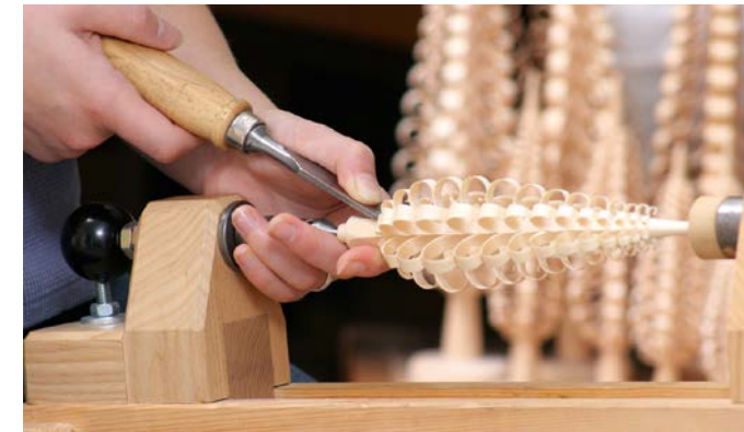
▼ Stechen eines Spanbaumes

nisse sowohl im traditionellen als auch im modernen Design. Schauen Sie den Kunsthandwerkern über die Schulter, die Ihnen zeigen, wie aus vielen Einzelteilen in zahlreichen Arbeitsschritten eine kunsthandwerkliche Figur entsteht.