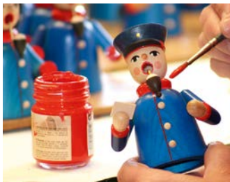
▼ Bemalen eines Räuchermannes

In der Schauwerkstatt, auf 3 Etagen, sehen Sie ausgewählte traditionelle Handwerkstechniken wie das Drechseln von Holz, Spanbaumstechen und Bemalen. Die Schauwerkstatt ist Montag bis Samstag geöffnet. Einlass: 10 – 12 Uhr, 13 – 16.30 Uhr