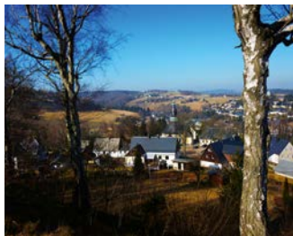
▼ Blick ins Tal

In der Nähe der Kirche befinden sich zwei benachbarte bis zu 34 m tiefe Einsturztrichter des Zinnbergbaus, die »Geyerin« und »Neuglucker Stockwerkspinge« genannt werden. Ein beschilderter Bergbausteig führt durch das geschichtliche Gelände und bietet atemberaubende Aussichten. April bis Oktober: Führungen