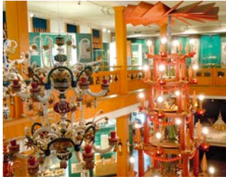
▲ Innenansicht vom Spielzeugmuseum

Wanderzeit: Spielzeugmuseum bis Richard Glässer (ca. 3 Min.) Richard Glässer bis Bergkirche (ca. 8 Min.) | Bergkirche bis Binge (ca. 5 Min.) Binge bis Freilichtmuseum (ca. 45 Min.) | Freilichtmuseum bis Glashütten- teich (ca. 40 Min.) | Glashüttenweg bis Seiffener Volkskunst (ca. 20 Min.)