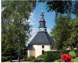
▲ Seiffener Bergkirche